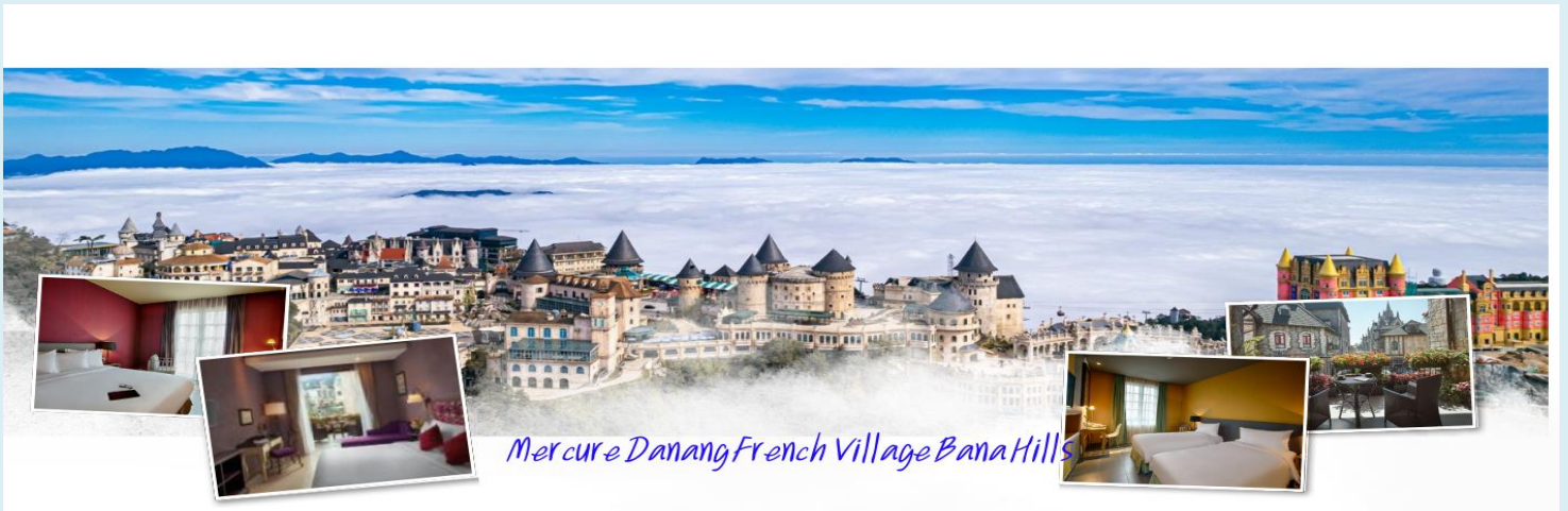
Mercuré Danang French Village Bana Hills

นำท่าน นั่งกระเช้าขึ้นสู่บานาฮิลล์ สัมผัสประสบการณ์ที่น่าตื่นเต้นพร้อมชมความสวยงามมากของธรรมชาติวิวมุมสูง บานาฮิลล์ตั้งอยู่ในจังหวัดดานัง ประเทศเวียดนาม เป็นสถานที่ท่องเที่ยวที่มีชื่อเสียงและยอดนิยมนับเป็นอย่างมา และตัวกระเช้าลอยฟ้าเองยังมีความยาวที่สุดในโลกที่เชื่อมระหว่างเทือกเขาและยอดเขาอีกด้วย เมื่อท่านนั่งกระเช้าชมวิวทิวทัศน์ที่สวยงามของภูเขาและป่าไม้ในระหว่างการเดินทาง นอกจากนี้บานาฮิลล์ยังมีสถานที่ท่องเที่ยวที่น่าสนใจมากมาย เช่น สะพานทอง (Golden Bridge) ที่มีลักษณะเป็นสะพานที่ถูกถือโดยมือยักษ์ รวมถึงสวนสนุกและรีสอร์ทต่างๆ ที่มีบรรยากาศสุดแสนโรแมนติก